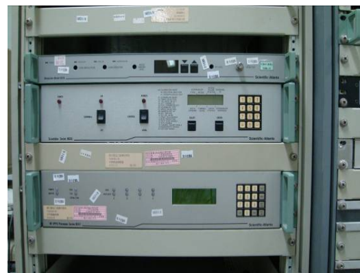
↑ IPPV 微處理機