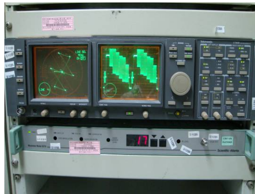
↑ NTSC 影像測試儀