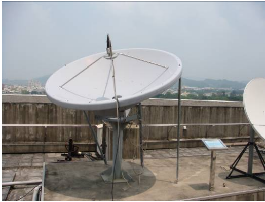
↑仰角方位角衛星調整天線