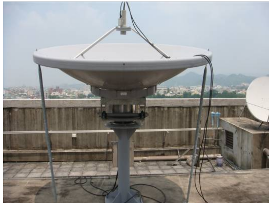
↑電動衛星調整天線