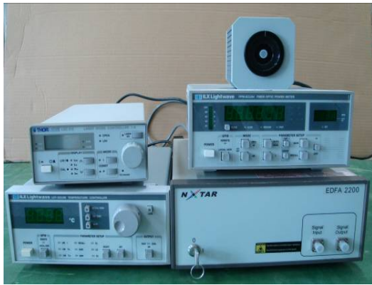
↑ 摻鉕光放大器分析組件