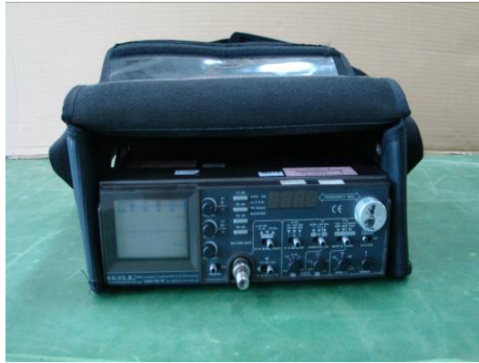
↑電視/衛星電場位準表