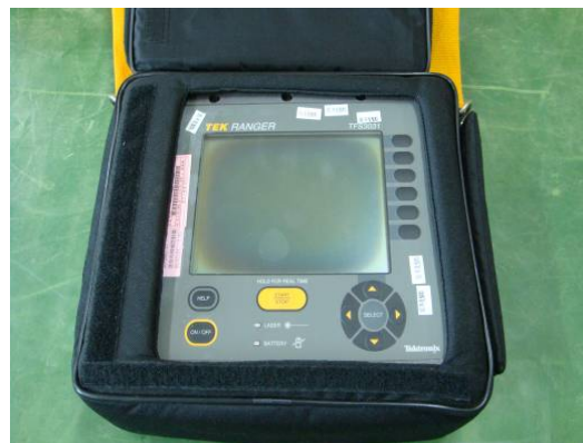
↑ 迷你光時域反射儀