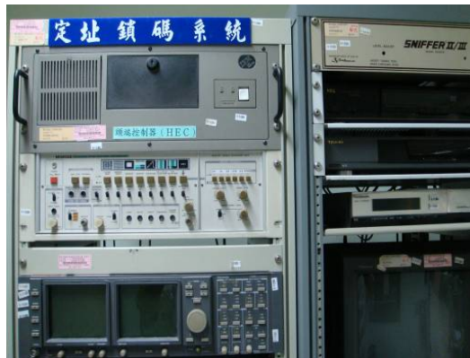
↑ 定址鎖碼主機系統