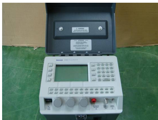
↑有線電視掃描系統