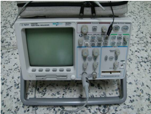
↑ 100MHZ 混合信號示波器