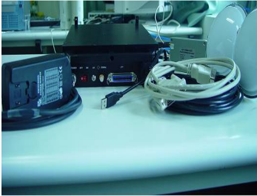
↑ 電磁時域脈衝分析儀