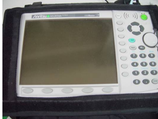
↑ 多功能網路頻譜分析儀