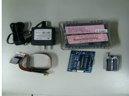
↑ PSoC ICE4000 發展系統