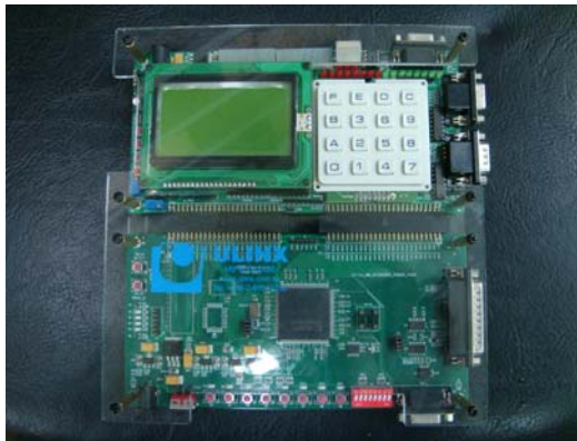
↑ FPGA 應用設計系統