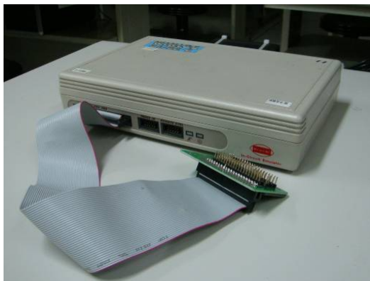
↑ 單晶片微電腦發展系統