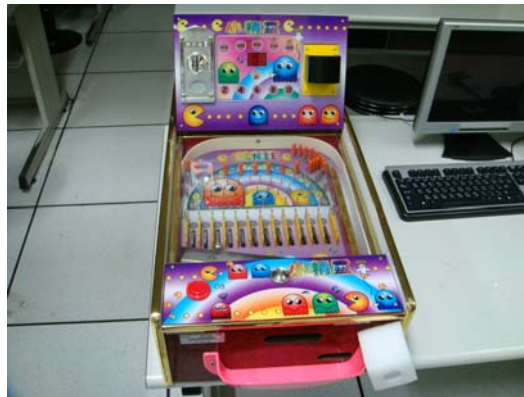
↑ 彈珠台遊戲機教學系統