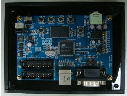
↑ MP3-USB Player 學習板