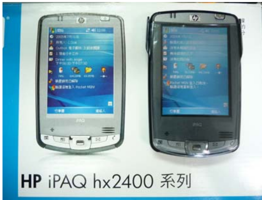
↑掌上型電腦開發系統