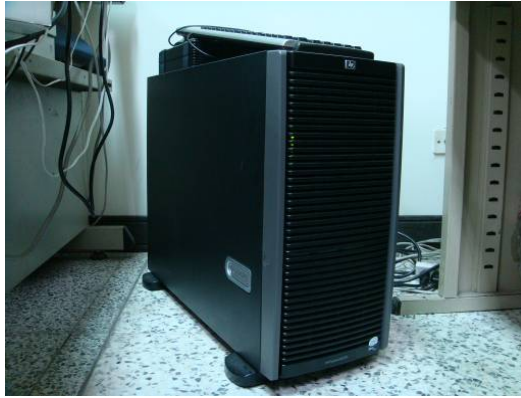
↑ HP 伺服器